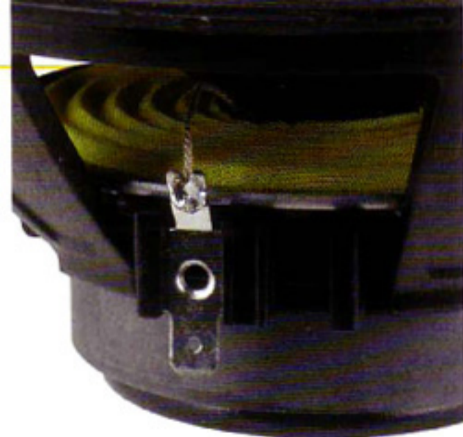
Auch die „Kleinteile“ der Lautsprecher sind von hoher Qualität, hier die Zentrierung aus bestem Material

Im Vergleich zur chromblitzenden Konkurrenz geben sich die Maestros eher dezent. Nichtsdestoweniger überzeugen sie mit bestem Material und Verarbeitung