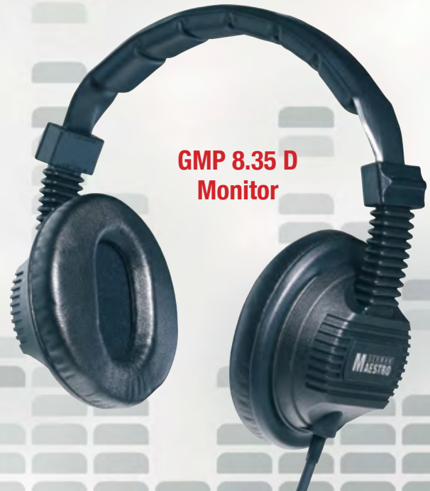
GMP 8.35 D Monitor

Acoustically open headphone for perfect sound reproduction with high dynamic response. Thanks to its transparency and linear frequency response the GMP 240 is ideal for all music tastes. The cardamatic suspension and the velvet ear pads guarantee perfect fit and excellent comfort. For passionate listeners this is great value for money.