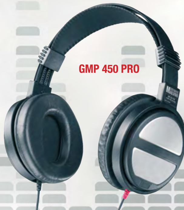
GMP 450 PRO

The GMP 400 represents the top range in headphone technology: Uncompromising sound reproduction with crystal clear trebles, rich details in the mid-range and precise dynamic response in the bass reproduction. The technical features are also very impressive: Sandwich-diaphragm, copper plated aluminium voice coils, ear cups with cardamatic suspension, ear pads made of a top-quality soft velvet and a gold plated Multi-Jack-plug. Many recording engineers' favourite headphone!