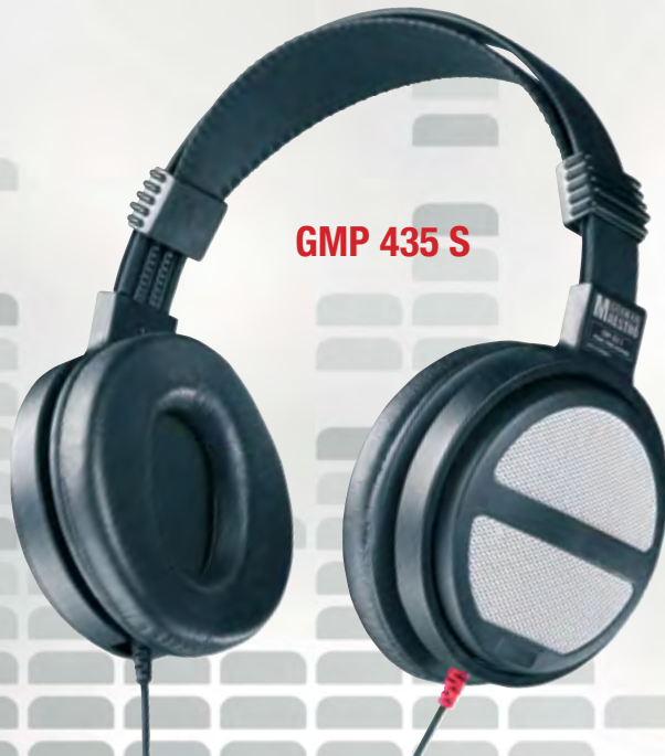
GMP 435 S