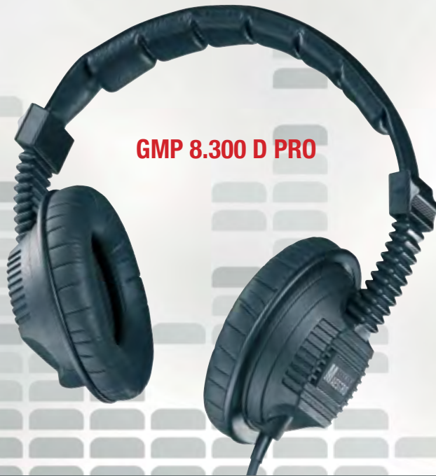
GMP 8.300 D PRO

Dieser akustisch geschlossene Kopfhörer von sehr hoher Klangwiedergabe-Qualität besteht jeden Härtestest! Der bruchsichere Stahlbügel ist aufwändig gepolstert und ergonomisch geformt. Einseitige Kabelzuführung, verdeckt geführte Verbindungsleitungen und robuste Kunststoffgehäuse sind Garanten für eine lange Lebensdauer.